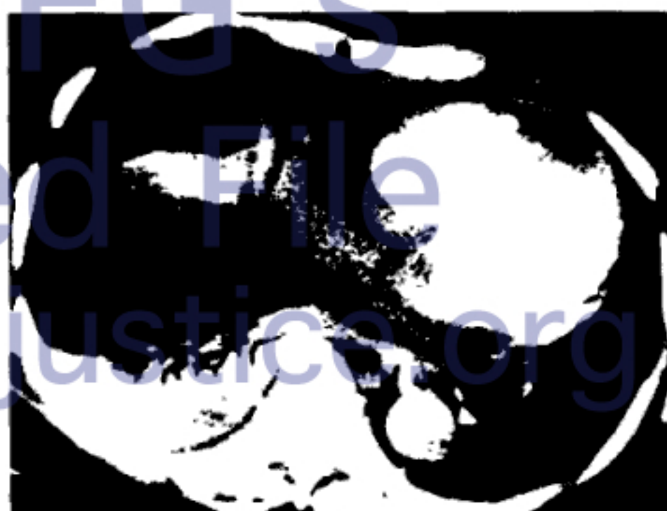
图 4 右胸腔积液伴右下肺不张 CT 片